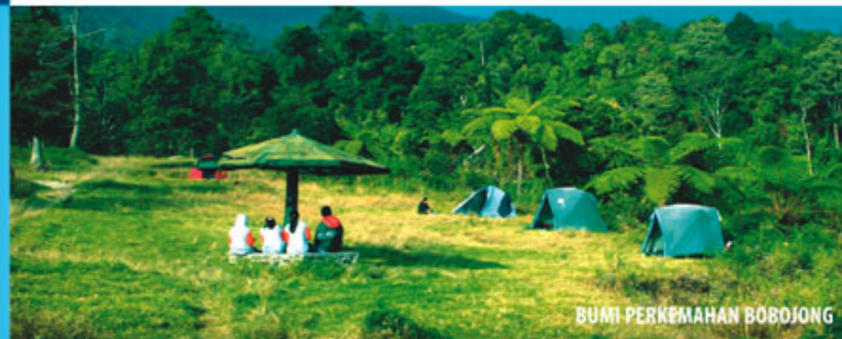
BUMI PERKEMAHAN BOBOJONG

Merupakan Bumi Perkemahan yang berlokasi di resort gn. Putri dengan luas areal 1ha. Kapasitas Bumi Perkemahan ini dapat menampung sekitar 100 orang (25 Tenda). Selain itu dilengkapi juga dengan fasilitas lainnya seperti : MCK dan pondok pemandangan. Untuk menuju lokasi ini dapat di tempuh + 1 Km/30 menit dari pintu masuk Gn. Putri Cipanas, Cianjur.