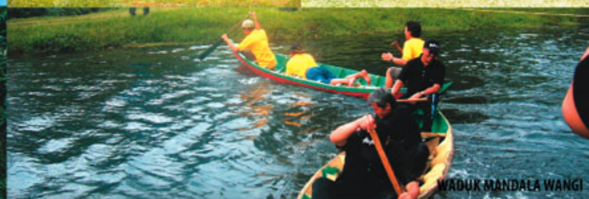
WADUK MANDALA WANGI