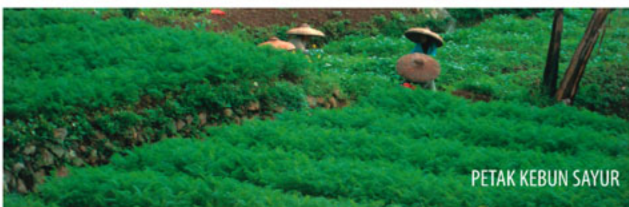
PETAK KEBUN SAYUR